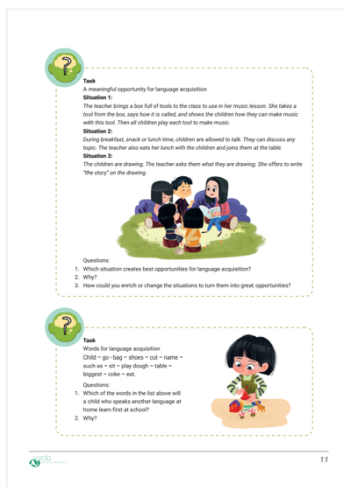
Ảnh 2. Trang nội dung tham khảo cho phần minh họa và dàn chữ